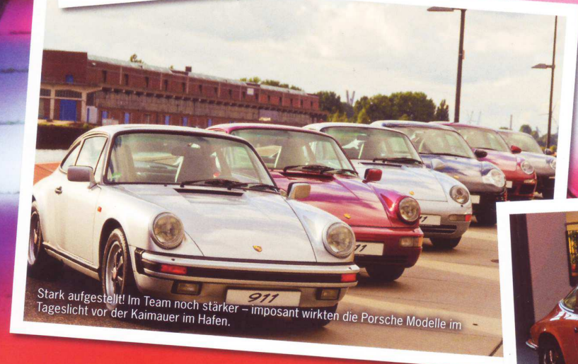
Stark aufgestellt! Im Team noch stärker – imposant wirkten die Porsche Modelle im Tageslicht vor der Kaimauer im Hafen.