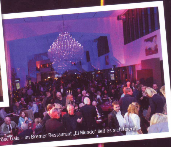
Glamouröse Gala – im Bremer Restaurant „El Mundo“ ließ es sich feiern!