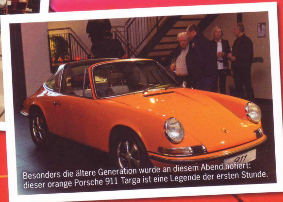
Besonders die ältere Generation wurde an diesem Abend hofiert: dieser orange Porsche 911 Targa ist eine Legende der ersten Stunde.