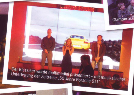
Der Klassiker wurde multimedial präsentiert – mit musikalischer Unterlegung der Zeitreise „50 Jahre Porsche 911“.